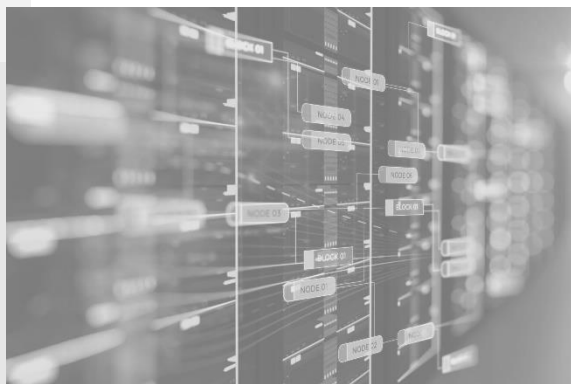
Динамика количества обслуживаемых реестров